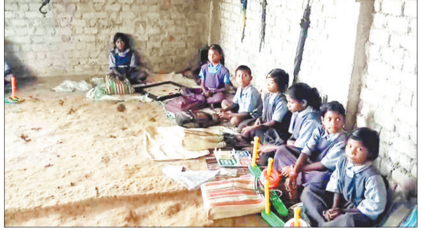
निर्माणाधीन स्कूल के कक्ष में रेत पर बैठकर पढ़ाई करते बच्च।

शंकरगढ़ विकासखंड के प्राथमिक शाला डाम्हाटोली स्थित प्राथमिक पाठशाला भवन